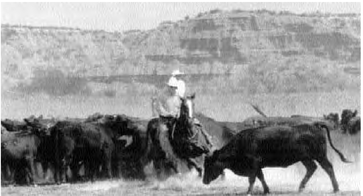
El aparte tuvo su origen en la necesidad del cowboy de separar un individuo del resto del lote de vacas, pero ahora se convirtió en un negocio.

Los rancheros juntaban el ganado, para marcar, castrar, vacunar y también para clasificarlos y llevarlos al mercado. Una vez que los vacunos han sido juntados, (lo cual no es un